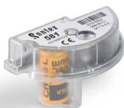
Module radio Sontex 433MHz