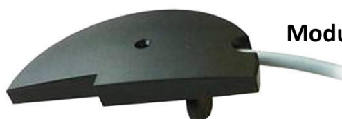
Module MBUS selon EN1434